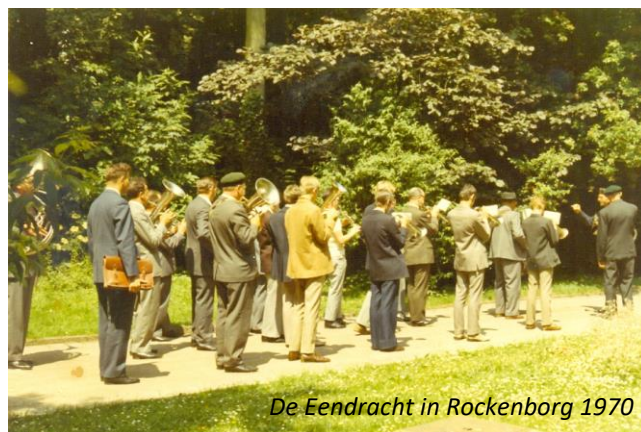
De Eendracht in Rockenborg 1970

We zullen kunnen merken hoe muzikanten die vandaag met grijs (of helemaal geen) haar rondlopen, eruitzagen als frisse knapen, of pittige jonge meisjes in het trommelkorps.