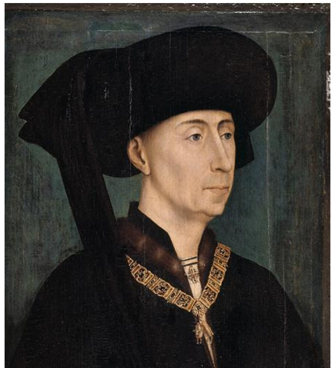
Filips de Goede, zoals hij afgebeeld staat op de voorpagina van 'De Bourgondiërs'