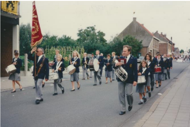
Lombeek en Borchtlombeek, Eendrachtig spelend op de Dikke Roosdaalse Feesten.